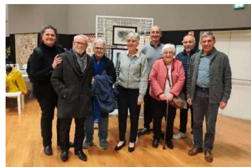
La section « culturactivités » de la Base aérienne 123 d'Orléans-Bricy