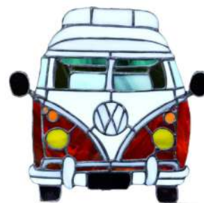
Prix du thème Métiers d'art

Retrouvez tous les palmarès et photos des œuvres sur notre site internet.