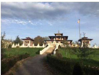
Le temple bouddhiste