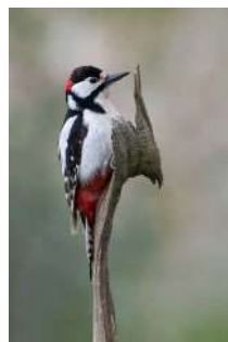
Prix nature Photographie

Félicitations aux artistes amateurs de la ligue pour leur participation mais également pour leurs prix.