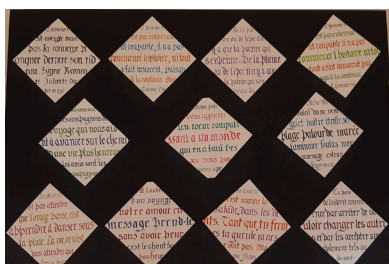
Chaque pratiquant a écrit une phrase en gothique fraktur, avec des plumes de quatre tailles différentes.

Pas de contrainte, pas d'obligation, chacun évolue à son propre rythme, et la bonne ambiance de ces deux heures est seulement parfois troublée par une exclamation de dépit lorsqu'une lettre est oubliée dans un mot ou lorsque l'encre vient tacher un travail presque terminé !