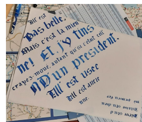
Ce texte, en pur berrichon, s'est très bien adapté à une transcription en rotunda !!!