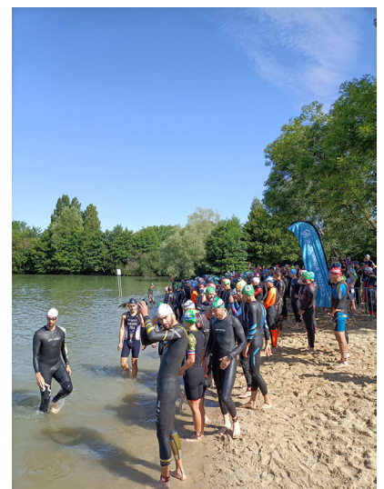
Base nautique de Belle-Isle de Châteauroux