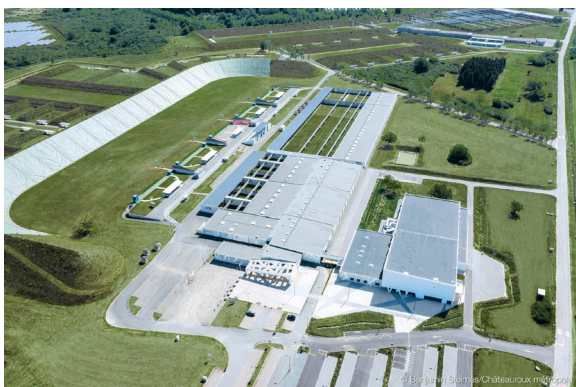
Centre National de Tir Sportif (CNTS) de Déols

Un grand merci d'avance à tous les bénévoles qui apporteront leur concours pour le succès de ces 3 manifestations.