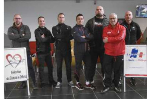
Formation Moniteur de mise en forme par la musculation