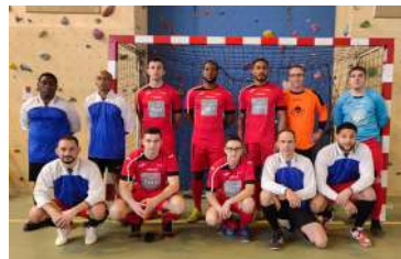
L'équipe de Nogent-le-Rotrou, en rouge, gagnante du match.