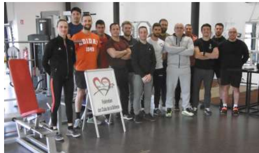
Formation Animateur de mise en forme par la musculation